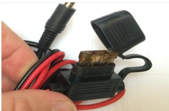
Установка проводки щеток